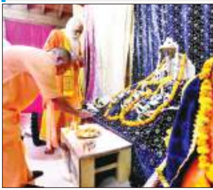
यूपी के मुख्यमंत्री योगी आदित्यनाथ ने अयोध्या में रामलला के दर्शन किए।