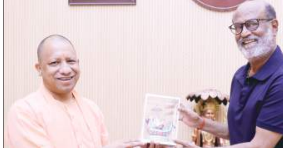
यूपी के मुख्यमंत्री योगी आदित्यनाथ से शनिवार को उनके सरकारी आवास पर फिल्म अभिनेता रजनीकांत ने शिष्टाचार भेंट की।

भारत की इन चीजों ने क्रांति ला दी: पीएम ने कहा कि जन धन खाते, आधार और मोबाइल फोन ने देश में डिजिटल ट्रांजैक्शन में क्रांति ला दी। कोरोना काल में जन-धन खाते में हमारी सरकार ने महिला लाभाधिक्यों के खाते में लगातार तीन महीने 500 रुपए डाले थे। सरकारी योजनाओं में सरकार को डायरेक्ट बेनिफिट ट्रांसफर से 33 अरब डॉलर से ज्यादा की बचत हुई। भारत प्राचीन परंपराओं से लेकर नई तकनीक में भी कुछ ना कुछ स्थान बनाए है। यह विविधताओं से भरा देश है। पीएम मोदी ने अपने संबोधन में कहा कि जो समाधान भारत में सफल होता है, उसे दुनिया में कहीं भी आसानी से लागू किया जा सकता है।