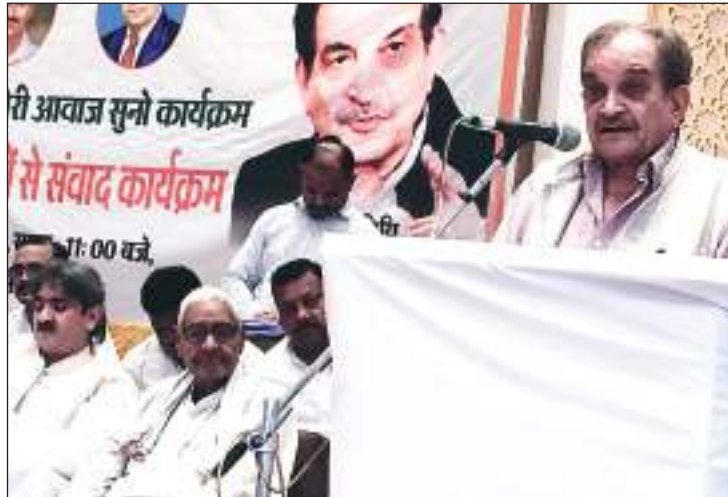
साल बाद गरीबी, भूखमरी, बेरोजगारी, भ्रष्टाचार जैसी मूल समस्याएं मुंह बाये खड़ी हैं। पिछली सरकारों ने अपने-अपने स्तर पर इन समस्याओं के लिए काम किया लेकिन जिस तरीके से करना चाहिए था, वो नहीं किया। उन्होंने कहा कि दो अक्टूबर की मेरी आवाज सुनो रैली में दो देश को अनुसंधनात्मक तरीके से इन समस्याओं को दूर करने के उपाय बतायेंगे। उदाहरण के लिए एमएसपी के साथ कृषि उत्पाद में वैश्व एडिशन

उन्होंने कहा कि 10 लाख रुपए देकर पेंशन लीक करवाने वाला कैसे भ्रष्टाचार से दूर रह सकता है। गांवों में स्वास्थ्य की सुविधाएं नहीं पहुंच रही। आज भी देश में आजादी के 76