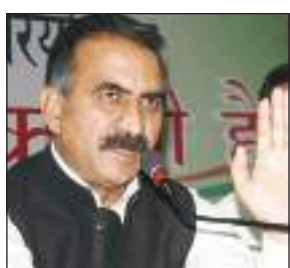
के दौरान पत्रकारों से बातचीत कर रहे थे। बीते रोज प्रदेश के सांसदों पर दिए बयान पर मुख्यमंत्री सुखविन्दर सिंह सुक्खू ने स्थिति साफ की है। सनद रहे कि प्रदेश

टीम एक्शन इंडिया/शिमला मुख्यमंत्री सुखविंदर सिंह सुक्खू ने कहा है कि राज्य को आपदा प्रभावित क्षेत्र घोषित किया गया है। प्राकृतिक आपदा में सरकार खुद के संसाधनों से राहत व पुनर्वास कार्यों में जुटी है। प्रधानमंत्री नरेंद्र मोदी से विशेष राहत पैकेज की उम्मीद है। उन्होंने कहा कि पीएम ने हमारी बात को गौर से सुना है। अधिकारियों को भी आवश्यक निर्देश दिए हैं। केंद्र से विशेष आर्थिक पैकेज जल्द मिलने पर बहाली के कार्यों में उतनी ही तेजी आएगी। मुख्यमंत्री दिल्ली प्रवास