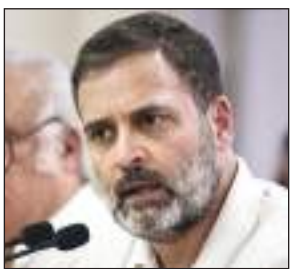
विपक्ष अक्सर उनके बीच समानताएं बताता रहा है। कांग्रेस नेता ने आरोप लगाया कि आरएसएस ही देश में सब कुछ चला रहा है। 'मंत्रालयों को चला रहे आरएसएस के लोग': पूर्व कांग्रेस प्रमुख का सोशल मीडिया पर एक

टीम एक्शन इंडिया/नई दिल्ली कांग्रेस नेता राहुल गांधी ने राष्ट्रीय स्वयंसेवक संघ (आरएसएस) पर हमला बोलते हुए आरोप लगाया कि दक्षिणपंथी संघटना देश के हर संस्थान में अपने लोगों को बिटा रहा है। लद्दाख में कथित तौर पर एक सार्वजनिक संवाद की एक वीडियो क्लिप में उन्होंने दावा किया कि केंद्रीय मंत्रिमंडल के मंत्री फैसले नहीं ले रहे हैं, बल्कि आरएसएस के एक सज्जन हैं, जो यह तय कर रहे हैं कि मंत्रालय में क्या होना चाहिए। आरएसएस को व्यापक रूप से भारतीय जनता पार्टी (भाजपा) की वैचारिक शाखा माना जाता है, और